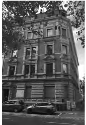
Ehemalige Gestapo-Zentrale, Kaiserstraße 31, Mainz

Junge Menschen, die sich heute im nahe gelegenen Stadtteil Hartenberg auf ihren Beruf als Erzieherin und Erzieher vorbereiten, erinnern zum 27. Januar mit dem „Gang der Erinnerung“ an die Verbrechen an jüdischen Menschen und rufen mit einem Friedensgebet zu Verständigung und Toleranz auf. An ausgewählten Standorten werden Zeitzeugenberichte zu den dortigen Ereignissen vorgetragen. Der Besuch der neuen Synagoge gehört ebenfalls zum Programm.