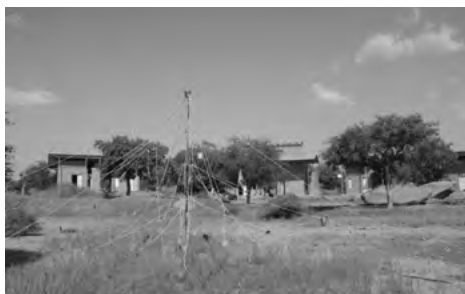
Operndorf Burkina Faso, © Sarah Hegenbart

VERANSTALTENDE: Akademie der Wissenschaften und der Literatur | Mainz