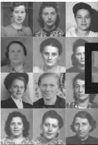
Luxemburger Frauen (Ausschnitt)

VERANSTALTENDE: Volkshochschule Trier in Kooperation mit der Frauenbeauftragten der Stadt Trier