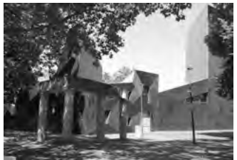
Neue Synagoge Mainz

Andererseits ist den Vertretern jedoch schmerzlich bewusst – und hierfür soll das Fragezeichen stehen –, dass die Zukunft der Erinnerungskultur weder gesichert noch selbstverständlich ist. Deshalb nehmen die Vertreter der Verfolgtengruppen den Tag der Befreiung von Auschwitz zum Anlass, um in der Neuen Synagoge Mainz kritisch über die Zukunft der Erinnerungskultur zu sprechen.