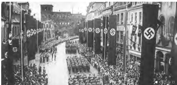
Trier im Nationalsozialismus, © AG Frieden e. V. Trier

„Zweifel vs. Zuversicht“ ist das Thema des ökumenischen Gottesdiensts der Evangelischen Studierendengemeinde (ESG) und der Katholischen Hochschulgemeinde (KHG) Trier.