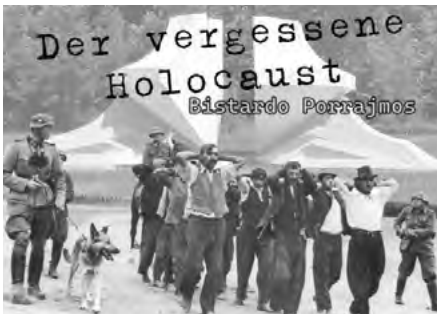
Der Vergessene Holocaust, Ausschnitt Filmplakat © Kadri Memiši

VERANSTALTENDE: Landtag Rheinland-Pfalz in Kooperation mit Medien & Kulturzentrum Deutscher Roma e. V.