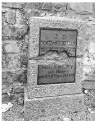
Freigelegtes Grabmal auf dem jüdischen Friedhof Bollendorf

VERANSTALTENDE: Förderkreis Synagoge Laufersweiler e. V.