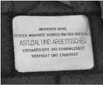
Stolperstein Berlin Alexanderplatz

Parlament, Regierung und geladene Gäste kommen zur zentralen Gedenksitzung des Landes in Mainz zusammen. Im Mittelpunkt der Erinnerung stehen erstmals lange Zeit verleugnete Opfergruppen. Sie mussten in den Konzentrationslagern den schwarzen oder den