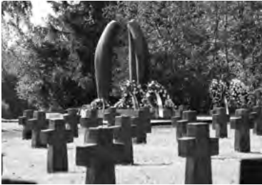
Gedenkstätte SS-Sonderlager/KZ Hinzert

ORT: Versand der Zugangsdaten erfolgt nach Anmeldung