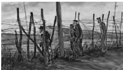
© Julius C. Turner „Männer im Morgenrot vor dem Stacheldraht- zaun“, Archiv für Zeitgeschichte/ Elsbeth-Kasser-Stiftung

Im Oktober 1940 deportierten die Nazi-Behörden mehr als 6500 Bürger jüdischen Glaubens aus der Pfalz, aus Baden und dem Saarland ins Internierungslager Gurs in Südfrankreich. Unter ihnen waren namhafte Künstlerinnen und Künstler. Sie gaben gemeinsam mit Musikern und Sängern aus anderen Teilen Deutschlands Konzerte für ihre Mitgefangenen, gründeten eine Kabarett-Truppe und ein Theater. Damit weckten sie bei vielen Internierten neuen Lebensmut und ließen sie für einige Stunden das Elend im Lager hinter Stacheldraht vergessen.