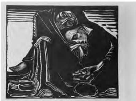
Käthe Kollwitz, „Tod mit Frau im Schoß“, 1921

Drei Frauen der ersten Generation professionell ausgebildeter Künstlerinnen im damaligen Deutschland veränderten die Kunst: Käthe Kollwitz stellte ihr Werk in den Dienst der von Hunger, Krieg und Unterdrückung gezeichneten Menschen. Paula Modersohn-Becker befreite sich von allen bildnerischen Konventionen. Ottilie W. Roederstein war die erfolgreichste Porträtistin ihrer Zeit. Von der nationalsozialistischen Kunstpolitik waren sie alle – auf unterschiedliche Weise – betroffen: Roederstein konnte ihre Porträts jüdischer Persönlichkeiten nicht mehr ausstellen, Kollwitz wurde aus der Preußischen Akademie der Künste ausgeschlossen, und die Kunst Modersohn-Beckers wurde als „entartet“ diffamiert.