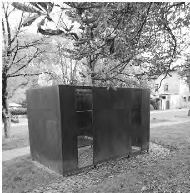
Andernacher Spiegelcontainer

VERANSTALTENDE: Rhein-Mosel-Fachklinik Andernach und Stadt Andernach